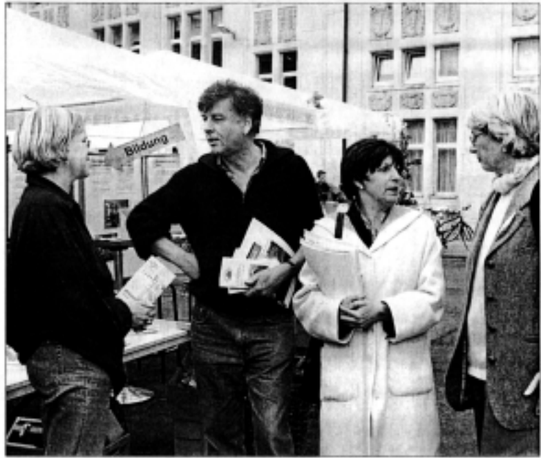
Über ihr Angebot informieren die Bildungsträger der Region Göttingen.

Konkrete Bildungsangebote präsentierten auf dem Veranstaltungsgelände verschiedene Träger: Die Gewerkschaften waren ebenso vertreten wie das Bildungswerk der niedersächsischen Wirtschaft und die Volkshochschulen der Region. Zum Fest machten die Veranstaltung Musik, Modenschauen und Akrobaten.