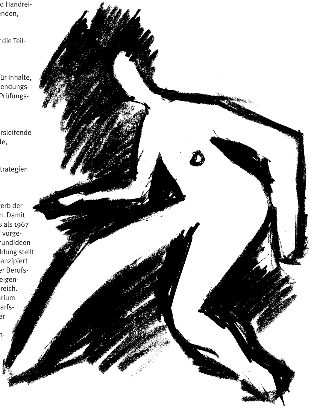
GRAFIK: KARSTEN MEIER