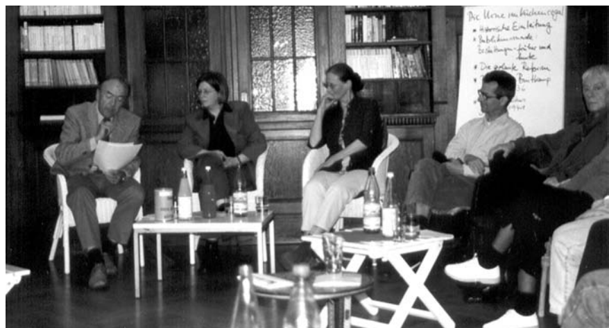
Aktuelles politisches Forum

FreieAltenarbeitGoettingen@t-online.de www.FreieAltenarbeitGoettingen.de